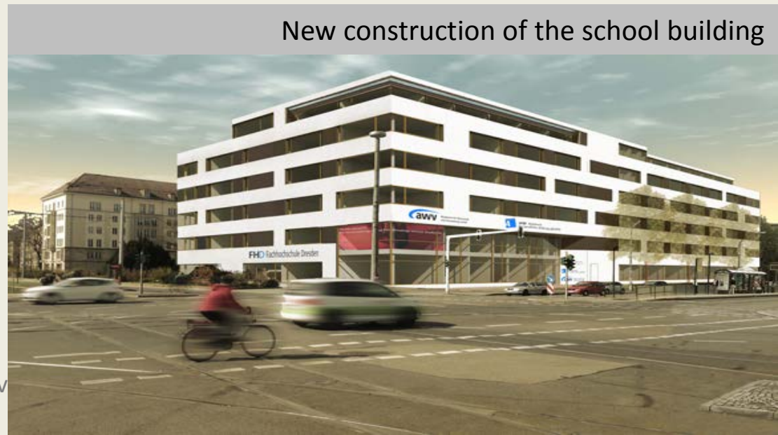
New construction of the school building